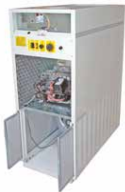
Quemador insonorizado. Filtro de admisión de aire. Sound insulated burner. Air inlet filter. Brûleur insonorisée. Filtre d'admission d'air.