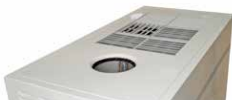
Rejilla de aire multidireccional Multidirection air grid/multidireccional Grille d'air multidirectionnel