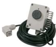
Termostato de ambiente con 10m de cable 135 € + IVA