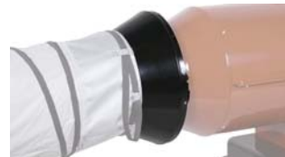
Adaptador manguera flexible AN 32 Ø300 95 € + IVA AN 55 Ø350 120 € + IVA AN 85 Ø400 160 € + IVA