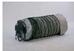
Manguera flexible 6m AN 32 Ø300 255 € + IVA AN 55 Ø350 295 € + IVA AN 85 Ø400 335 € + IVA