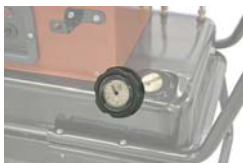
Indicador de nivel 56 € + IVA