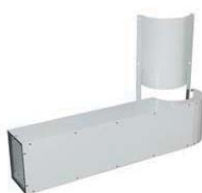
Conducto impulsión aire 195€ + IVA