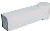
Conducto aspiración aire 185€ + IVA