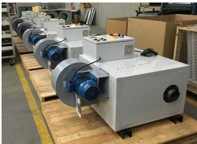
AGM con ventilador de media presión AGM with medium pressure fan AGM avec ventilateur moyenne pression

NUESTROS EQUIPOS CUMPLEN CON EL REGLAMENTO (UE) 2016/426 CORRESPONDIENTE A EQUIPOS QUE FUNCIONAN CON COMBUSTIBLES GASEOSOS Y REGLAMENTO (UE) 2016/2281 CORRESPONDIENTE AL DISEÑO ECOLÓGICO