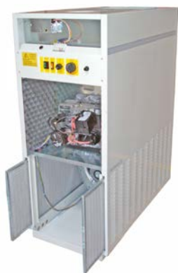
Quemador insonorizado. Filtro de admisión de aire. Sound insulated burner. Air inlet filter. Brûleur insonorisée. Filtre d'admission d'air.