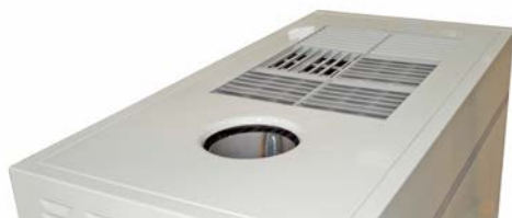
Rejilla de aire multidireccional Multidirection air grid/multidireccional Grille d'air multidirectionnel