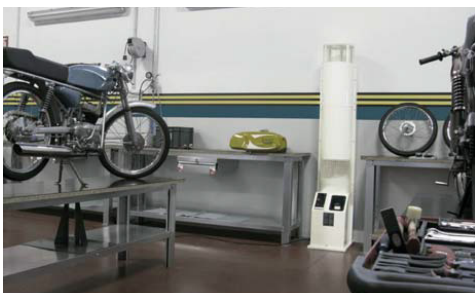
Instalación en un taller mecánico Installation in a mechanical workshop Installation dans un atelier mécanique