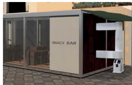
Instalación para calentar un snack-bar Installation to heat a snack-bar Installation pour chauffer un snack-bar