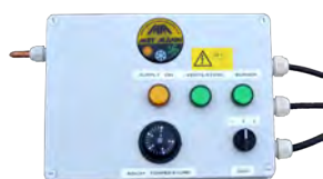
Control remoto mural Wall remote control Télécommande murale