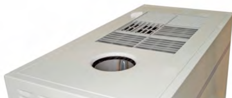
Rejilla de aire multidireccional Multidirection air grid/multidirectionnel Grille d'air multidirectionnel