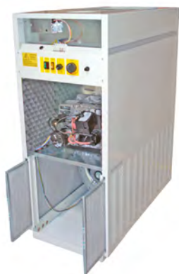
Quemador insonorizado. Filtro de admisión de aire. Sound insulated burner. Air inlet filter. Brûleur insonorisée. Filtre d'admission d'air.