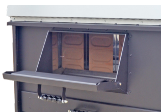
Amplio hogar de combustión Big combustion chamber Grande chambre de combustion