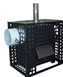
Jaula de protección Protection cage Cage de prévention