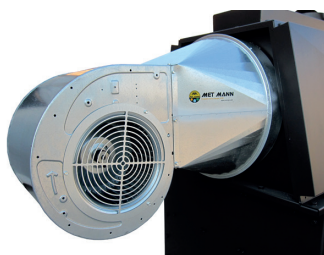
Ventilador centrífugo o axial para poder canalizar el aire Centrifugal or axial fan to channel the air Ventilateur ou axial centrifuge pour canalizer l'air