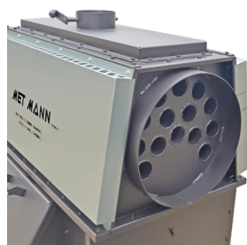
Intercambiador de calor de alto rendimiento Heating exchanger of high performance Échangeur de chaleur d'haute rendement