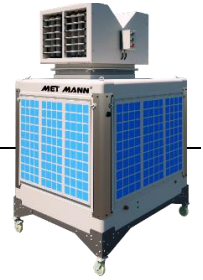
Prestaciones AD-15 (2,2 kW)