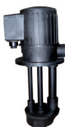
AZ 007 M AZ 007 T AZ 009 T