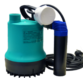
WILO DRAIN TM32 con interruptor de nivel