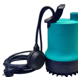
WILO DRAIN TM32