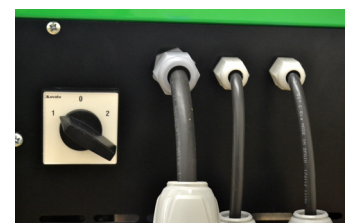
Multi-tensión Multi tension Multi tension