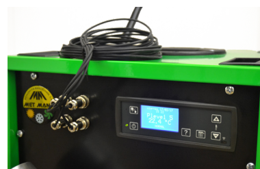
Control electrónico Electronic control Contrôle électronique