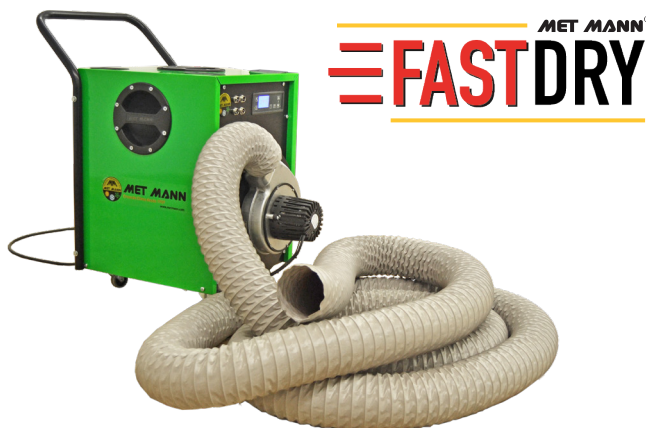
Calefactor eléctrico con conducto Electric duct heater Chauffe-eau électrique