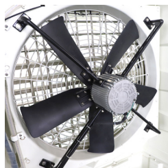
Ventilador axial de 3 velocidades 3-speed axial fan Ventilateur axial à 3 vitesses