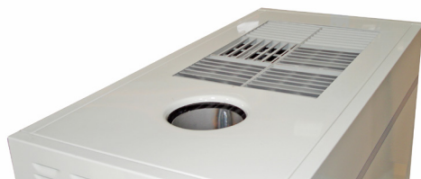
Rejilla de aire multidireccional Multidirection air grid/multidireccional Grille d'air multidirectionnel