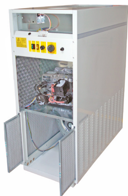
Quemador insonorizado. Filtro de admisión de aire. Sound insulated burner. Air inlet filter. Brûleur insonorisée. Filtre d'admission d'air.