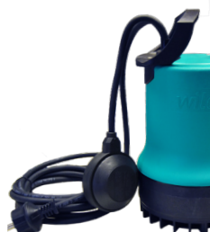
WILO DRAIN TM32