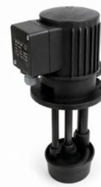
AZ 007 AZ 009