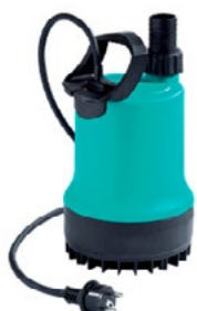
WILO DRAIN TM32