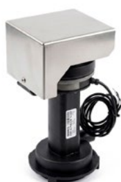
ALPHA 45/15 + SOMBRERO